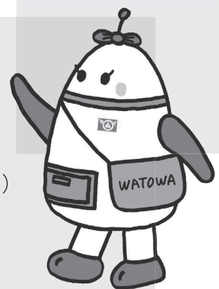
長野県社会福祉事業団 マスコットキャラクター 「ワトワちゃん」