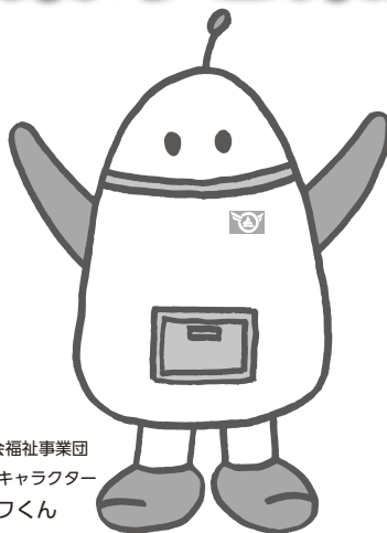
長野県社会福祉事業団 マスコットキャラクター ワトワくん