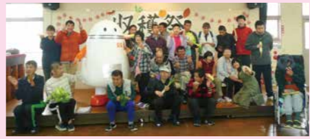
ワトワくんとの記念撮影(ばれっと)

西駒郷駒ヶ根日中支援課では畑づくりや日々の活動に取り入れています。収穫した野菜は年2回開催の収穫祭でカレーや豚汁として味わいます。今回の収穫祭(H27.11.25開催)には、調理ボランティアの皆さんの他にワトワくんも登場！イベントを盛り上げてくれました(180人参加)。お腹のポケットから野菜を取り出すワトワくんにも利用者さんもボランティアの皆さんも興味津々。ワトワくんとの写真撮影も行い、とても楽しい収穫祭となりました。