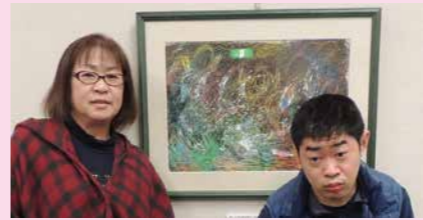
お母さんと記念撮影(巡回展にて)