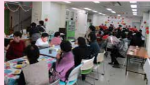
りんごパイを食べながらステージ発表を鑑賞

辰野町地域活動支援センターでは一昨年の町内のりんご農園のりんごオーナーとなり、摘果作業体験や収穫、調理実習等の活動をしています。また、地域の方と一緒に「収穫イベント」を開催しており、3回目となる今回(H27.12.2開催)は「50周年のオリジナルりんご」を作った皆さんに振る舞いました。 交流会には約90人が参加し、利用者やボランティアの発表、喫茶コーナーの営業等、拍手や笑顔があふれるアットホームなイベントとなりました。