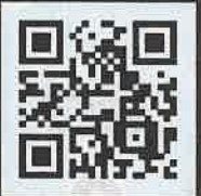
HADO モンスター バトル動画